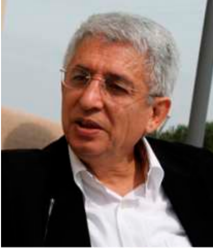
Av. FİKRET İLKİZ Türk Ceza Hukuku Derneği Başkanı