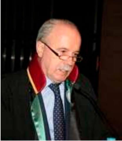
Av. Ayhan ERDOĞAN İstanbul Barosu Avukatlarından