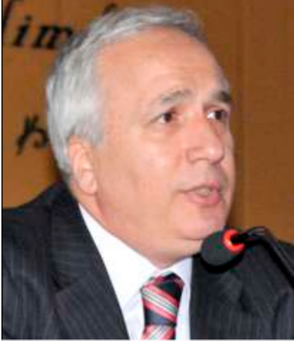
Ömer Uğur GENÇCAN Yargıtay 2. Hukuk Dairesi Üyesi