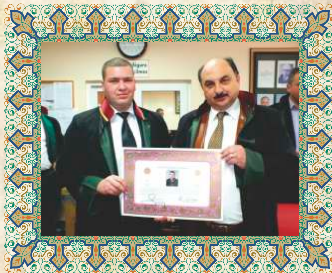
Av. Selim ÖDEMiŞ