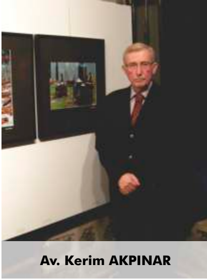
Av. Kerim AKPINAR