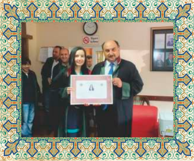
Av. Zehra MERİ