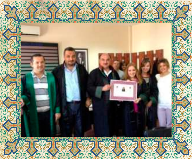
Av. Eda KARABATAK