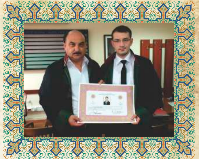
Av. Ömer Faruk YANIK