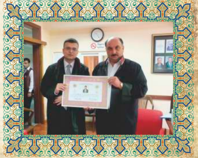
Av. Cem DEMİRKAYA