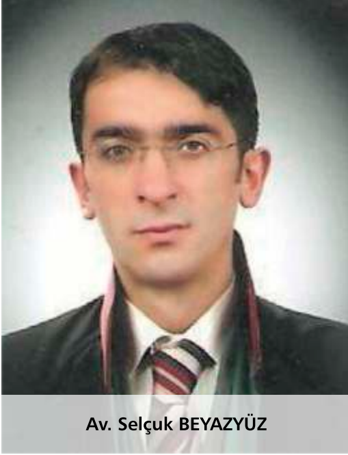
Av. Selçuk BEAZYÜZ