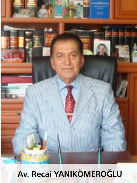
Av. Recai YANIKÖMEROĞLU